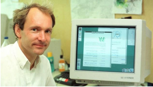
Tim Berners Lee – „Erfinder des www“